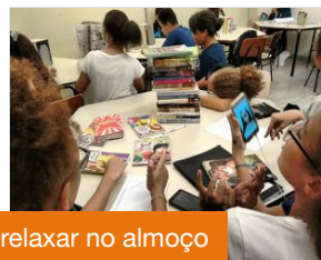
relaxar no almoço