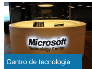
Centro de tecnologia