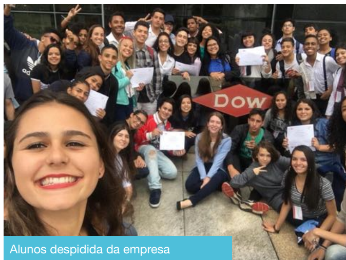
Alunos despedida da empresa

Uma ótima oportunidade para conhecerem um ambiente corporativo e conhecer novas áreas de uma empresa importante, conhecer os escritórios, os laboratórios entre outros lugares. Os alunos puderam conversar e receber experiências daqueles que já estão na área há algum tempo, e ver como funciona o serviço deles nessa empresa.