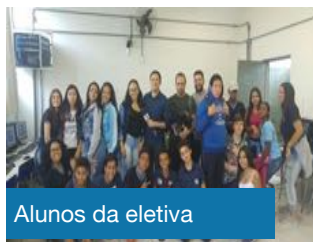
Alunos da eletiva