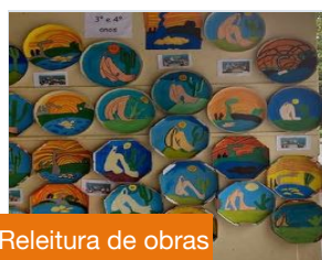
Releitura de obras

professoras de arte da escola fizeram uma Releitura de Obras de alguns artistas. Este trabalho faz com que as crianças tenham contato com a arte desenvolvendo assim