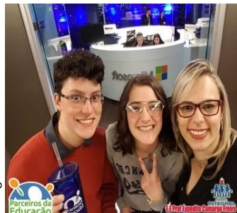
Imagens da internet