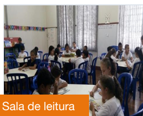
Sala de leitura

Certamente será uma experiência incrível!