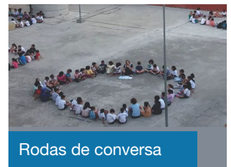
Rodas de conversa