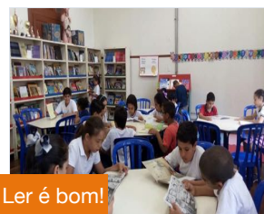
Ler é bom!