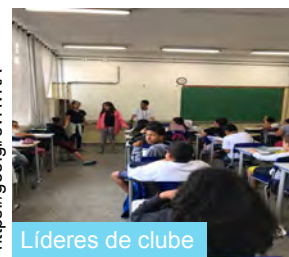
Alunos nas eletivas