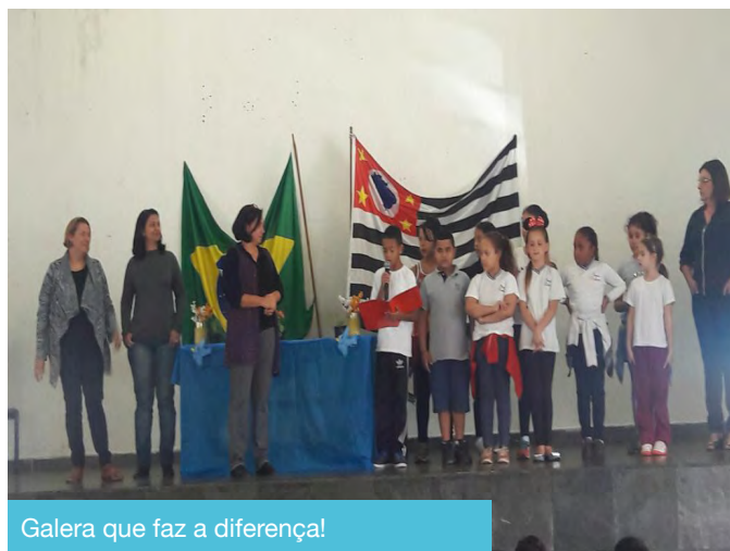
Galera que faz a diferença!

O Grêmio já desenvolveu diversas atividades, dentre elas: "Projeto Alimentação Saudável", que visa diminuir a quantidade de carne e aumentar o consumo de legumes e verduras, e para isso atuou junto a horta da escola; foi responsável pelo "Correio Elegante" em nossa Festa Junina; idealizou e desenvolveu o "Projeto Soletrando", com todos os alunos da escola; atua junto