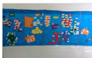
Curiosidades do mundo

Os alunos pesquisaram sobre a localização geográfica, os primeiros habitantes, a cultura e os costumes de cada país.