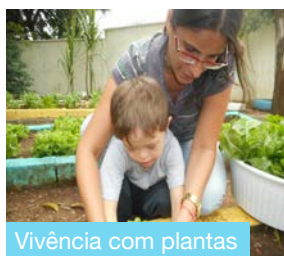
Acervo da escola