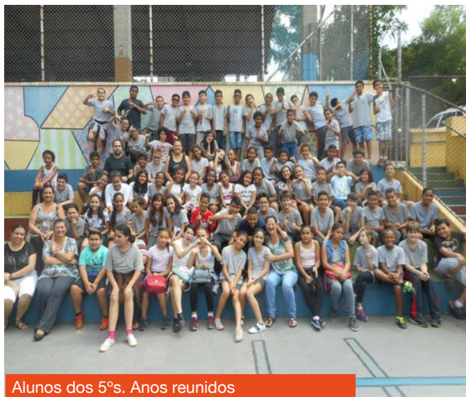
Acervo da escola

conseguiram! Vocês já passaram por tantas coisas... mas, ainda terão um longo caminho. E, nesse novo caminho, desejamos a vocês: muita vontade de vencer, garra, foco, raça e determinação. Dessa forma, vocês realizarão todos os seus sonhos e terão sucesso em suas vidas. Mas, é preciso que continuem sonhando, lutando e, principalmente, estudando.... Agora, ficará uma saudade que vai acompanhá-los para sempre, não é? Lembranças dos amigos, dos professores, da diretora, das coordenadoras... Enfim,